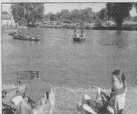
Les joutes étaient le clou de la journée.

La Maison des Loisirs et de la Culture et les mariniers de Grignon organisaient, dimanche 10 juillet, les Escapades au Port de Grignon dans le cadre des animations estivales du Loiret « Au fil de l'eau », avec la participation financière du Département, de la communauté de communes et de la municipalité de Vieilles-Maisons.