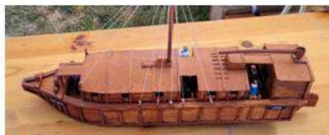
Maquette d'une Galiote réalisée et présentée par Mr Maisse, maquettiste, aux Escapades