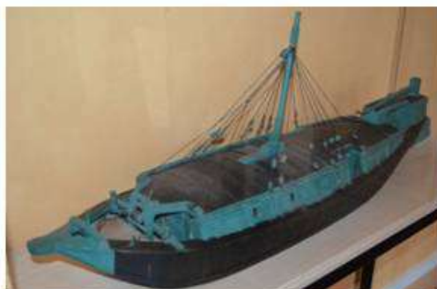
Maquette du Saint Victor réalisée par Vincent Coullon en 1850