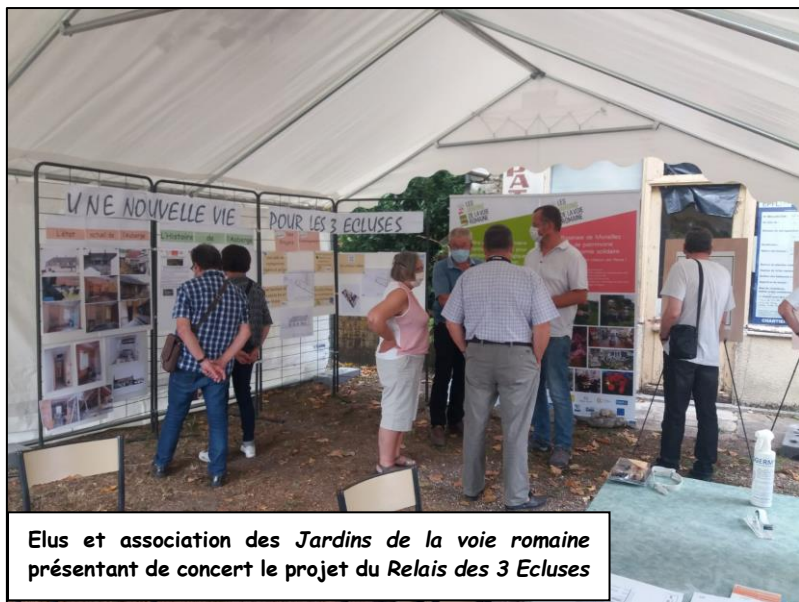
Elus et association des Jardins de la voie romaine présentant de concert le projet du Relais des 3 Ecluses

Cette association d'insertion prendra en gestion la boutique de produits locaux, le café et sa restauration légère, les gîtes d'étapes pour cyclotouristes, les salles d'exposition ou d'ateliers.