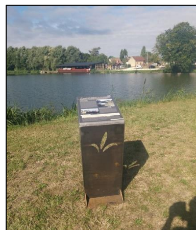
Le nouveau lutrin face à la « Belle de grignon »

Des visites libres ont permis la découverte du site le long du nouveau sentier historique du Port de Grignon où a été installé un nouveau lutrin financé par le département du Loiret.