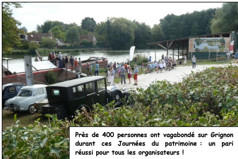
Près de 400 personnes ont vagabondé sur Grignon durant ces Journées du patrimoine : un pari réussi pour tous les organisateurs !

Grâce aux visites organisées par l'association des mariners de Grignon, les visiteurs ont découvert le patrimoine fluvial du canal d'Orléans en bateaux électriques sur l'Étang de Grignon mais aussi la péniche « Belle de Grignon » à quai. Un film sur grand écran proposait une rétrospective de sa construction. De plus un nouveau projet de construction d'un coche d'eau verra le jour bientôt.